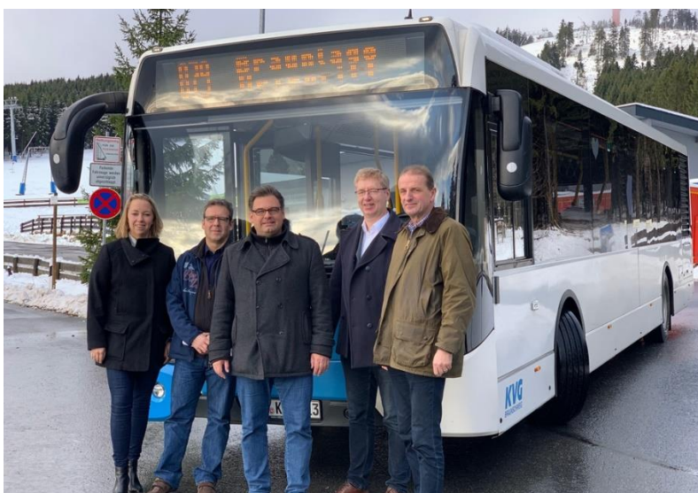
Abbildung 5: Skibus in Braunlage

Seit Dezember 2019 verkehrt der zur Ski-Saison 2019/2020 neu eingeführte „Skibus“ zwischen Braunlage und dem Skigebiet Hexenritt. Die Saisonverkehrslinie trägt die Nummer 879 und fährt im 30-Minuten-Takt.