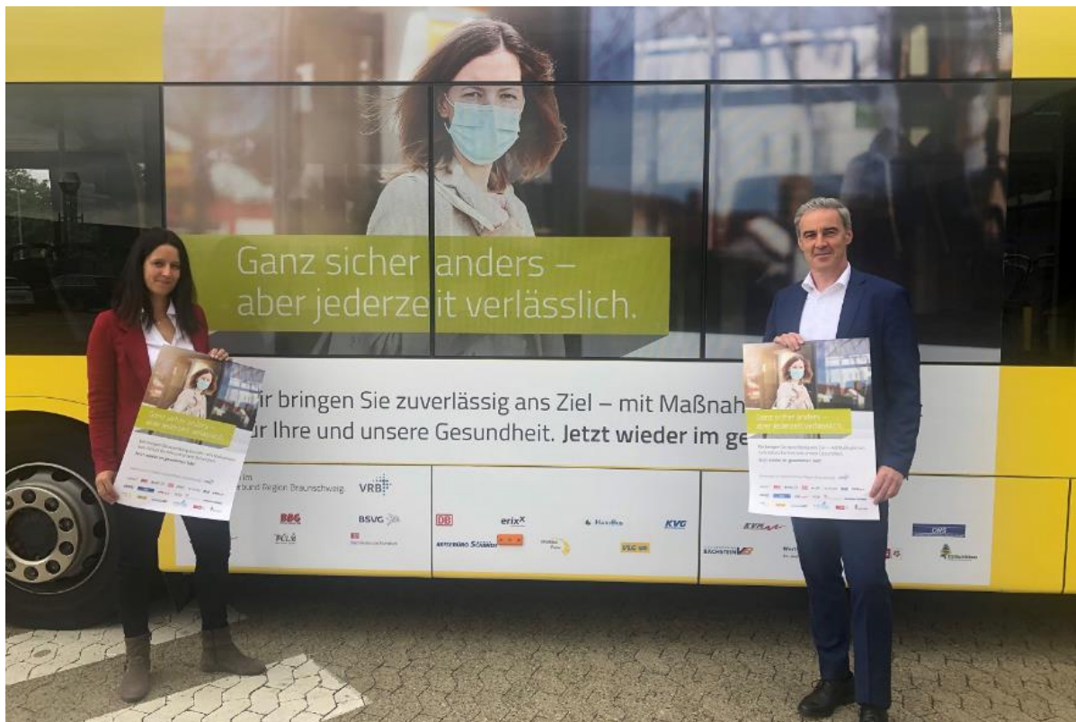
Abbildung 11: Corona-Kampagne im Großraum Braunschweig

Als ein Beispiel für die Intensivierung der Marketingaktivitäten kann an dieser Stelle die Kampagne während der Corona-Pandemie im Sommer 2020 genannt werden. Initiiert vom Regionalverband wurde eine Kampagne von den Verkehrsunternehmen und der Verkehrsverbund Region Braunschweig GmbH (VRB) erstellt. Diese diente vor allem dazu, das Vertrauen der Fahrgäste in die Sicherheit und Zuverlässigkeit des ÖPNV zurückzugewinnen. Aufmerksamkeit erregte die Kampagne durch Plakate auf und in den Bussen, durch Radiospots und Online- und Print-Anzeigen.