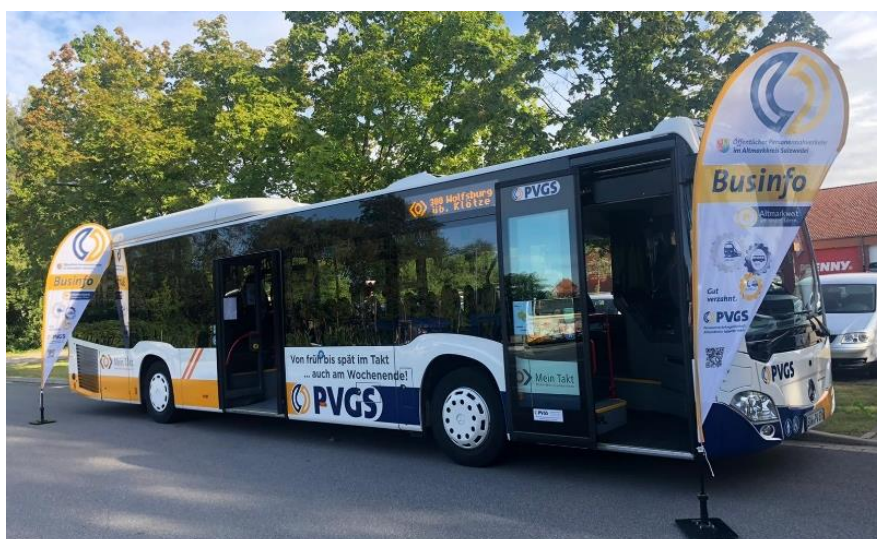
Abbildung 4: Landesbuslinie 300

2020 wurde zum ersten Mal in der Region eine sogenannte Landesbuslinie in Betrieb genommen. Seit Beginn des Schuljahres 2020/2021 verkehrt die Landesbuslinie 300 der PVGS (Personenverkehrsgesellschaft Altmarkkreis Salzwedel mbH) zwischen Salzwedel – Klötze – Wolfsburg. Für Fahrgäste aus den Gemeinden Rühen und Parsau bedeutet dies zudem ein zusätzliches ÖPNV-Angebot nach Wolfsburg. Neben der bisher schon verkehrenden Buslinie 160 können Fahrgäste nun auch mit der Landesbuslinie 300 via Brechtorf direkt ins Oberzentrum fahren. Weitere Informationen dazu unter Stadt Wolfsburg.