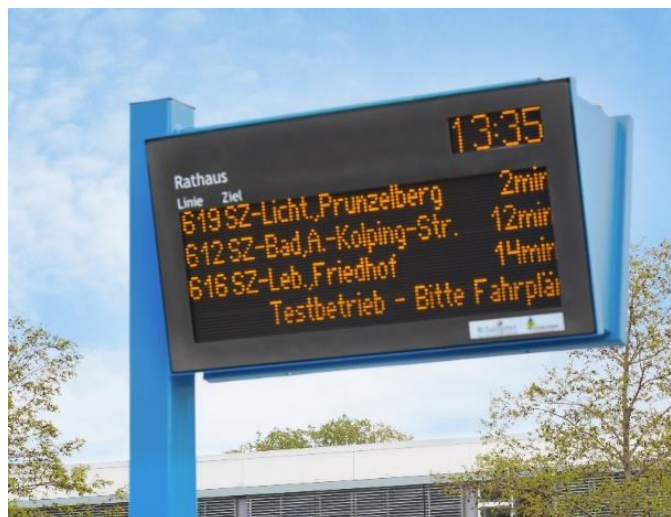
Abbildung 9: Echtzeitdaten an einer Haltestelle in Salzgitter-Lebenstedt; Foto Stadt Salzgitter / A. Kugellis

Bis Mitte 2022 wird im Großraum Braunschweig ein Echtzeitfahrgastinformationssystem vollständig eingeführt werden. An insgesamt 457 Haupteinstiegshaltestellen im Verbandsgebiet können die Fahrgäste dann die nächsten Abfahrten auf einem dynamischen Fahrgastinformationsanzeiger (DFI-Anzeiger) verfolgen – in Echtzeit. Auch über kurzfristige Störungen im Betriebsablauf oder Baustellen wird von den Verkehrsunternehmen in der Region über die DFI-Anzeiger zukünftig informiert werden können. Insgesamt beteiligen sich 22 Kommunen bzw. Verkehrsunternehmen an der Ausstattung von Haltestellen mit DFI.