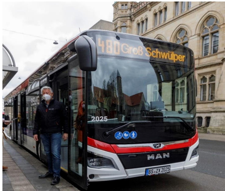
Abbildung 6: Die Buslinie 480 der BSVG

Durch das neue Verkehrsangebot wächst Braunschweig noch besser mit seinem Umland zusammen, da beispielsweise die RegioBus-Linie 480 die Braunschweiger Innenstadt im Stundentakt mit Groß Schwülper verbindet.