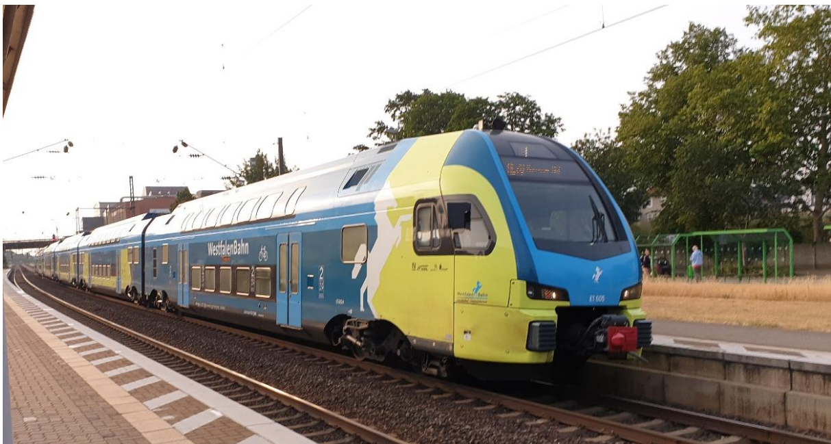
Abbildung 3: Die Westfalenbahn (RE60/70) am Bahnhof Peine