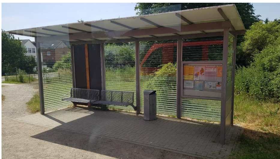
Abbildung 1: Verkehrsstation Immendorf

Die „Förderinitiative Attraktivitätssteigerung und Barrierefreiheit von Bahnhöfen“ (FABB) der Deutschen Bahn unterstützt den barrierefreien Ausbau kleinerer und mittlerer Bahnhöfe zwischen den Jahren 2019 und 2026, über die der Regionalverband mehrere Verkehrsstationen angemeldet hat. Im Rahmen der FABB sollen auch die Stationen Salzgitter-Watenstedt und Salzgitter-Immendorf bis voraussichtlich 2025 modernisiert werden.