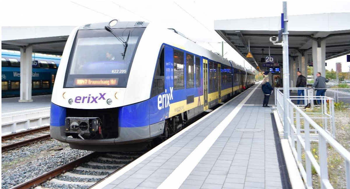
Abbildung 2: RB47

Seit Dezember 2020 fahren die erixx-Züge zwischen Braunschweig, Gifhorn und Uelzen täglich im geregelten Stundentakt, 38 Züge pro Tag in beide Richtungen. Damit wird ab sofort auf allen Schienenstrecken im Verbandsgebiet mindestens ein Stundentakt angeboten.