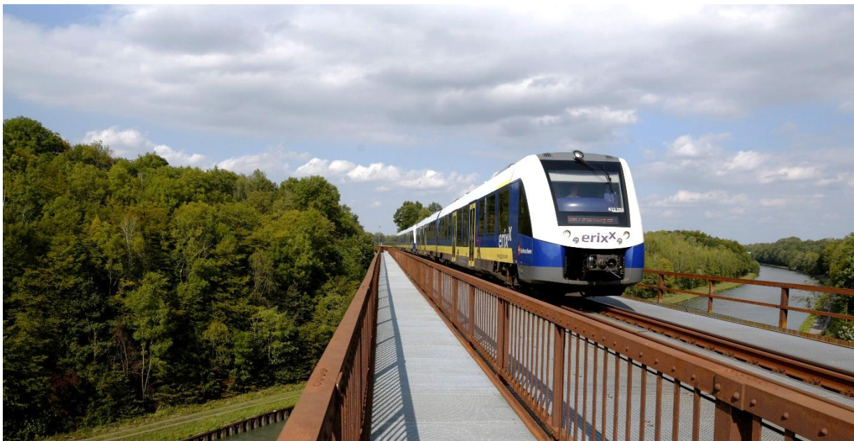
Abbildung 12: Die Einführung des Stundentaktes an der RB 47 wurde mit Broschüren begleitet

Da für die Einführung eines Stundentaktes auf der RB47 auch viele infrastrukturelle Arbeiten nötig waren, hat sich die der Regionalverband dazu entschlossen, die Bewohner der Region über die konkreten Maßnahmen und technische Hintergründe zu informieren, um hier für Verständnis zu werben, warum die Einführung eines dichteren Taktes im Schienenverkehr zum Teil sehr langatmig sein kann.