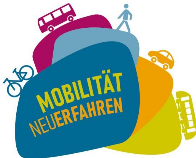
Abbildung 10: Logo Mobi38

U. a. wurde mit diesem Budget die Marke „mobi38“ erstellt und eine neue Internetseite ( www.mobi38.de ) eingerichtet. Neben der Internetseite informieren auch regelmäßig erscheinende Newsletter über Themen der Mobilität.